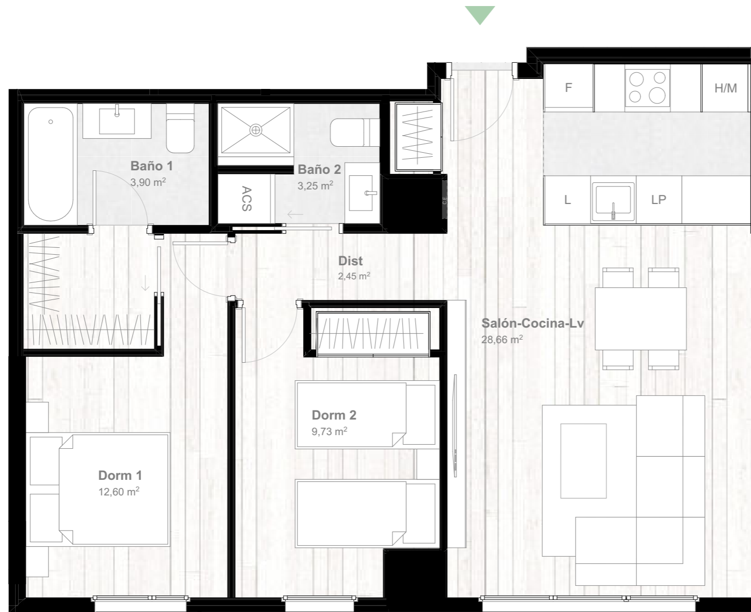
*Salón-Cocina-Lv: Superficie integrada de salón + cocina + lavadero

PARCELA RL-A del P.E.R.I. SUNC-R-R.5 "Martiricos" Dos torres de viviendas y hotel. Paseo de Martiricos nº 30, Málaga.